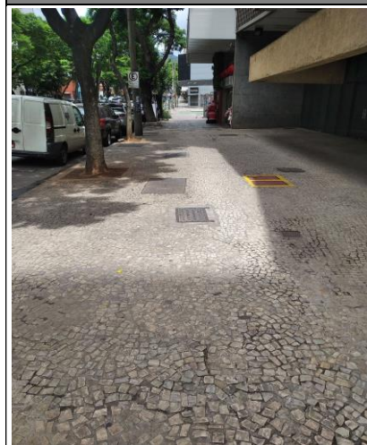
Fotos Complementares - Detalhes do Passeio