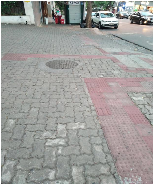
Fotos Complementares - Detalhes do Passeio