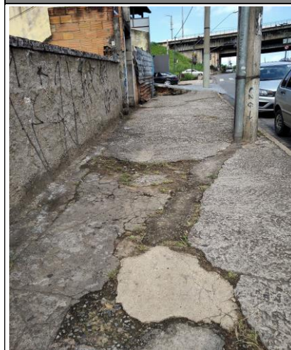
Fotos Complementares - Detalhes do Passeio