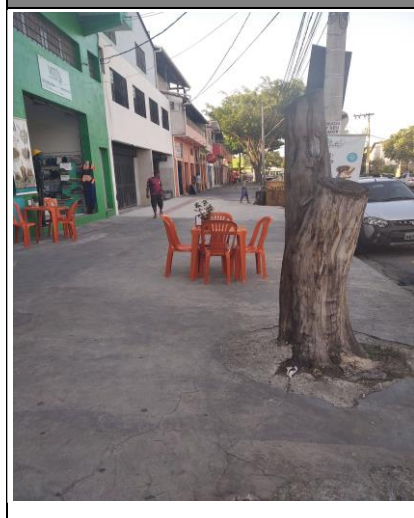
Fotos Complementares - Detalhes do Passeio