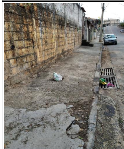
Fotos Complementares - Detalhes do Passeio