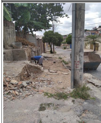
Fotos Complementares - Detalhes do Passeio