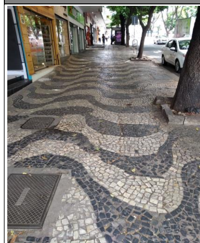
Fotos Complementares - Detalhes do Passeio