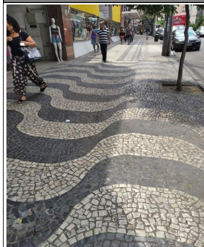
Fotos Complementares - Detalhes do Passeio