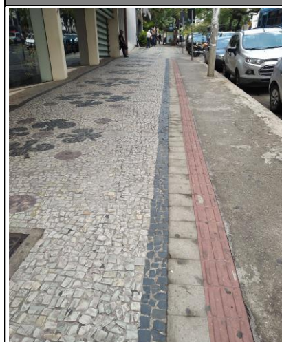
Fotos Complementares - Detalhes do Passeio