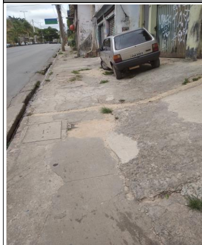
Fotos Complementares - Detalhes do Passeio