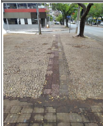
Fotos Complementares - Detalhes do Passeio