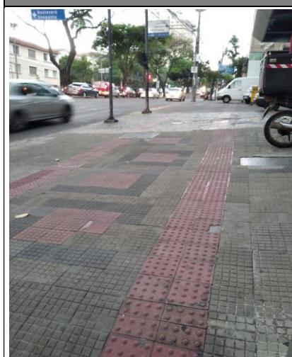
Fotos Complementares - Detalhes do Passeio