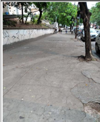
Fotos Complementares - Detalhes do Passeio