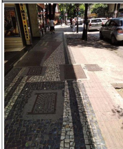
Fotos Complementares - Detalhes do Passeio