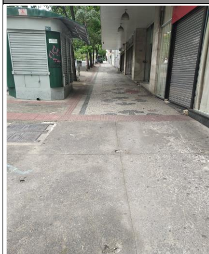
Fotos Complementares - Detalhes do Passeio