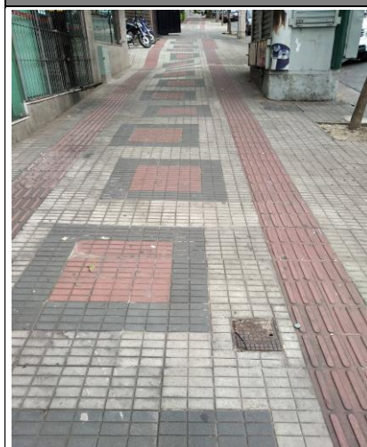
Fotos Complementares - Detalhes do Passeio