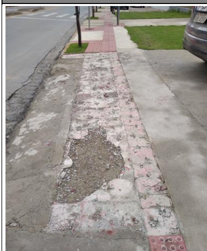
Fotos Complementares - Detalhes do Passeio