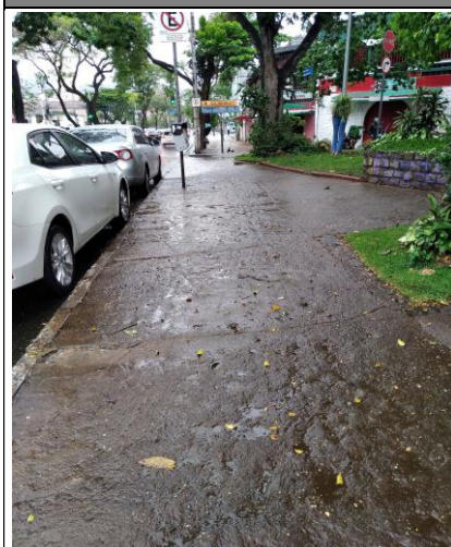
Fotos Complementares - Detalhes do Passeio