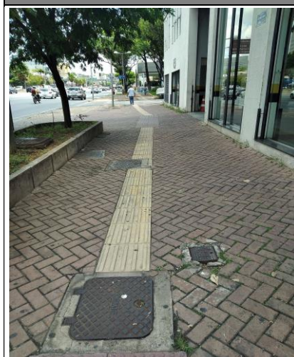
Fotos Complementares - Detalhes do Passeio