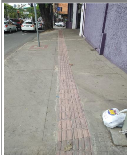
Fotos Complementares - Detalhes do Passeio